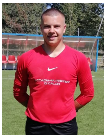
Maglia leggera manica lunga €21,00