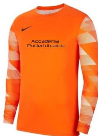
Maglia Portiere manica lunga €27,00