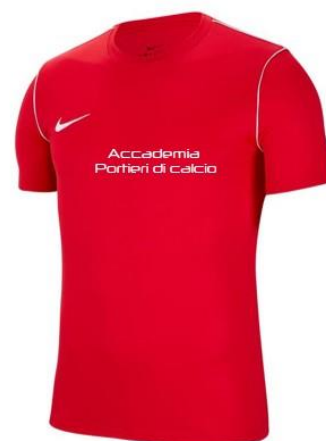
T-Shirt € 16,00